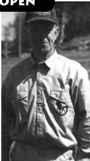
Ursnygg klubb skjorta, eucalyptus med vinrött tryck! Modell: Nisse.

Materialansvarig: Ulrika Persson 0300-213 92