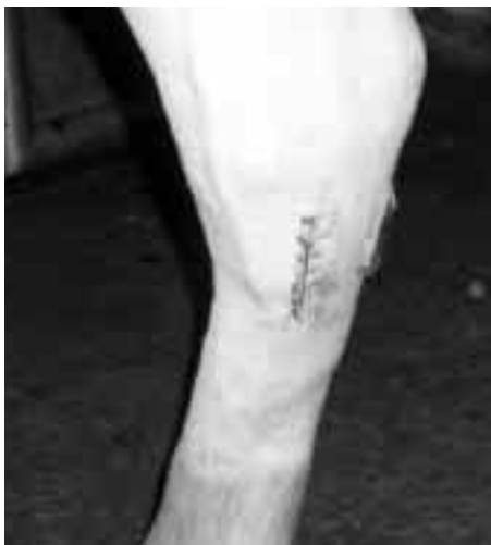
Stygnen efter operationen.

Vaknade tidigt och konstaterade att om det gällt arbetet så hade jag inte förflyttat mig ur sängen men nu gällde det ju Skjóni och då alla jobbade och jag själv skulle köra upp så var det bara att trycka i sig ett gäng Alvedon mot febern och sen sätta igång.