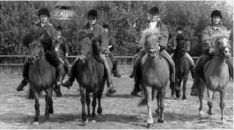
Klevsvikskadriljen in action.