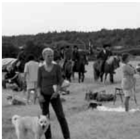
Hundar, hästar och människor på plats i Klevsvik.