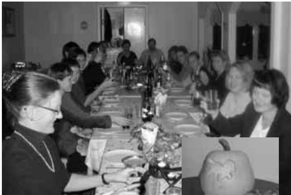
På kvällen var det fest på Fegens vandrarhem, där det bjöds på god mat och dryck. Flertalet av gästerna sov över.

jag vid rävsporten och skulle fotografera men allt gick så snabbt så jag hann varken få någon bild eller se exakt hur det hela gick till.