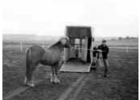
Rúbin ville först inte bli lastad. Dag två går han själv på transporten.