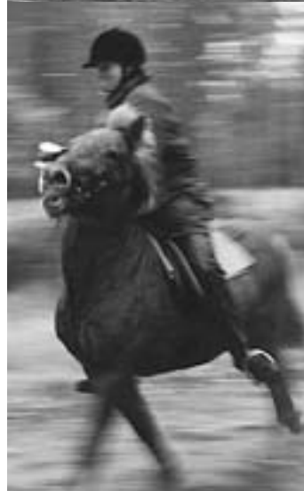
Flagglopp och öltölt - två roliga grenar att tävla i på Alt. KM!