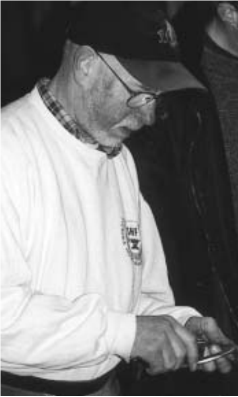
Thore var kursledare.