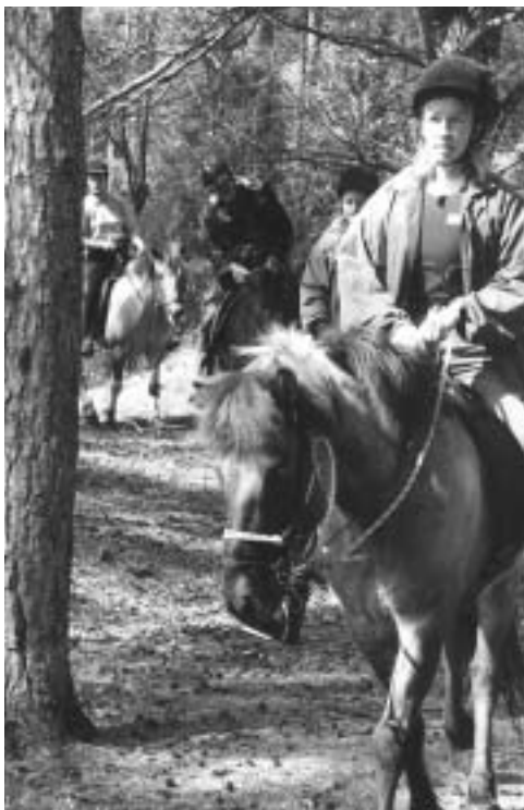
Hungriga ryttare och hästar framme vid Lilla Iglatjärn.