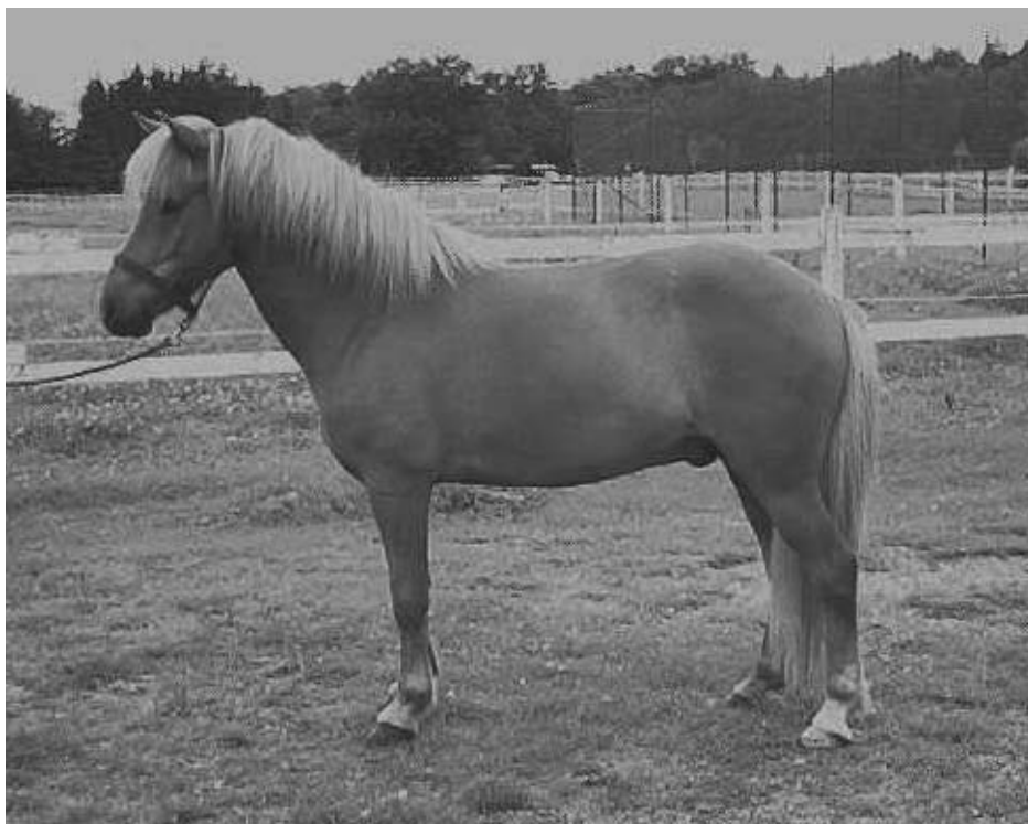
Här är en snygg bild på mig i profil.

Hälsningar från Tyrffingur - på det stora hela ganska nöjd med livet