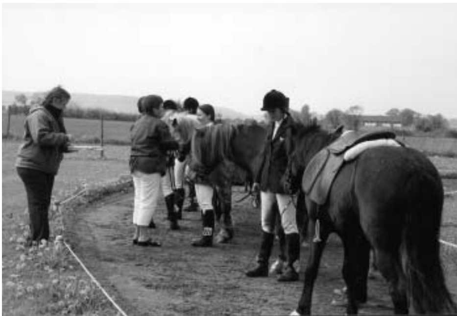
Prisutdelning i Lätt fyrgång.

Nog om detta. Finalsöndagen infann sig med lite svalare och ostadigare väder.