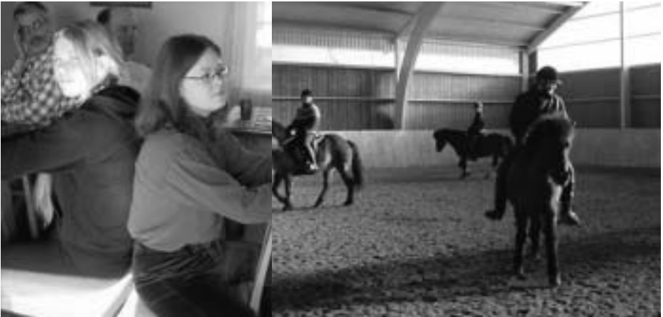
Praktiska övningar i ridhuset.