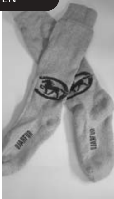
Sköna, varma Bola-strumpor med Djarfur logo.

Försäljningsställen: Stall Klevsvik, Skogsgårde Islandshästar