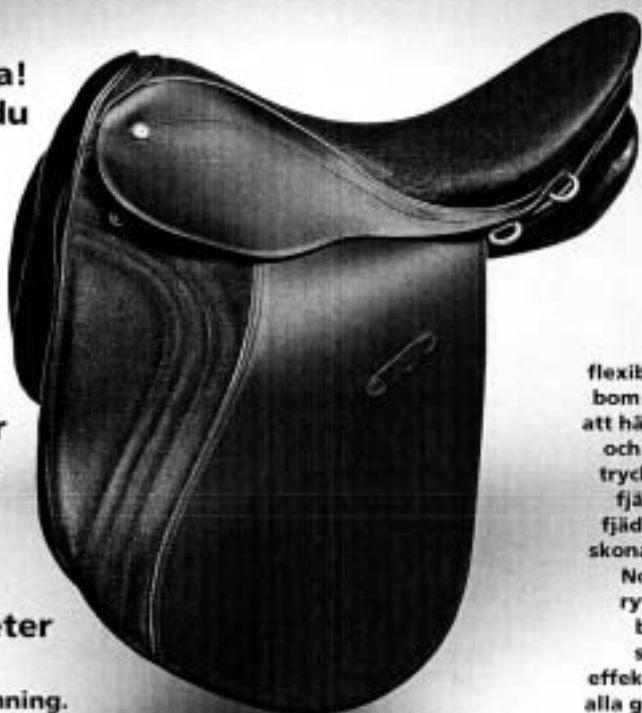
Nordica Exclusive, svart vattenbuffelskinn

Nordicas flexibla fjäder- bom försäkrar att hästens lyft och ryttarens tryck samlas i fjäderboms- fjädrarna och skonar hästen. Nordica ger ryttaren ett behagligt, säkert och effektivt säte i alla gångarter!