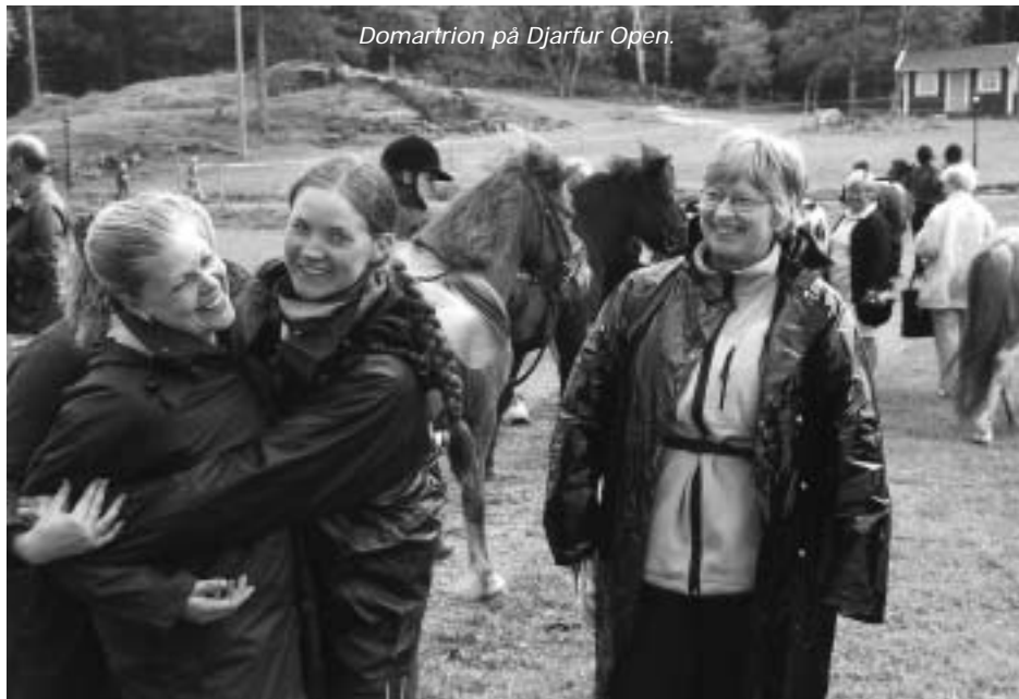
Domartrion på Djarfur Open.