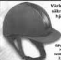
GPA hjälm, svart, till 2.750:-

Vid köp för mer än 2.000:-, räntefri avbetalning på 12 månader!