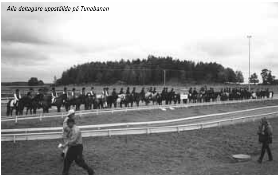
Alla deltagare uppställda på Tunabanan