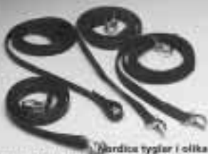
Nordica tyglar i olika utfärganden, svart/ och bruna, från 495:-