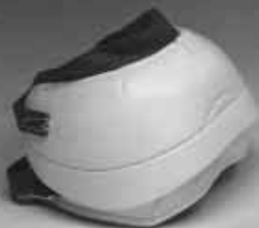
Featherweight USA Boots, handsydd, 270 g. Stl medium, large 1.695:-