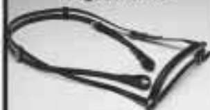
Nordica trän, svart & brunt 685:-