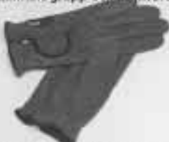
Nordic rithandsbär, flera färger 295:-