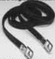
Prestige stigläder svart/bruna 795:-