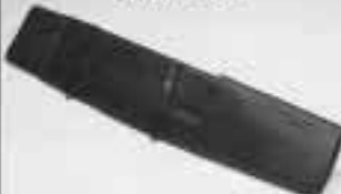
Nordica D-gjord svart & brun 795:-