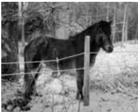
Grimur njuter i vintersolen